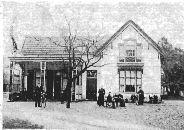
Hôtel „de Pyramide van Austerlitz”, gem. Woudenberg.