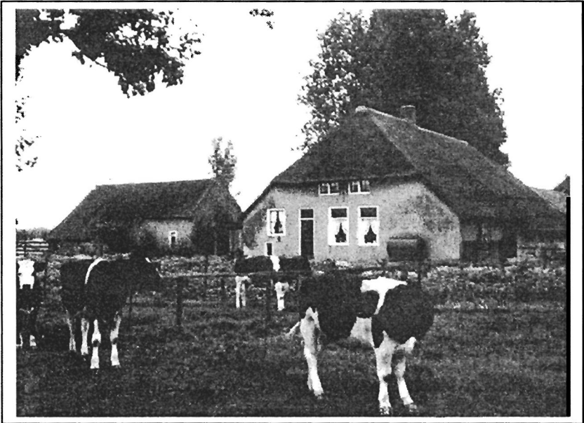
Boerderij Egdome het Eerste (Lambalgseweg 13, Woudenberg) in 1982. 17 De stamboerderij van de Van Egdome's die afstammen van Cornelis Arisz.

Voor de meeste Van Egdome's geldt, dat hun familienaam is ontleend aan het gelijknamige goed in Woudenberg.