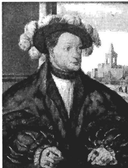
Karel van Egmond, de toenmalige Hertog van Gelre

Uit de tekst die de heer Van Gent aanhaalt, wordt niet echt duidelijk of met 'de Geldersen' de inwoners van Scherpenzeel werden bedoeld. Het lijkt niet erg aannemelijk dat de Hertog van Gelre , die hof hield in Rozendaal bij Arnhem, bij de invallen en rooftochten gebruik maakte van de inwoners van aan het bisschopsdom Utrecht grenzende dorpelingen, zoals de toenmalige inwoners van Scherpenzeel . Dat sluit natuurlijk niet helemaal uit dat een enkeling uit het grensgebied achter de troepen van de Hertog van Gelre aantrok en enige buit probeerde te maken.