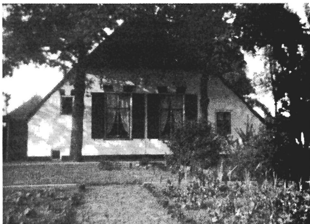
Boerderij 't Plaatsje op Voskuilen

'Voskuilen, een buurtschap onder Woudenberg en Leusden'.