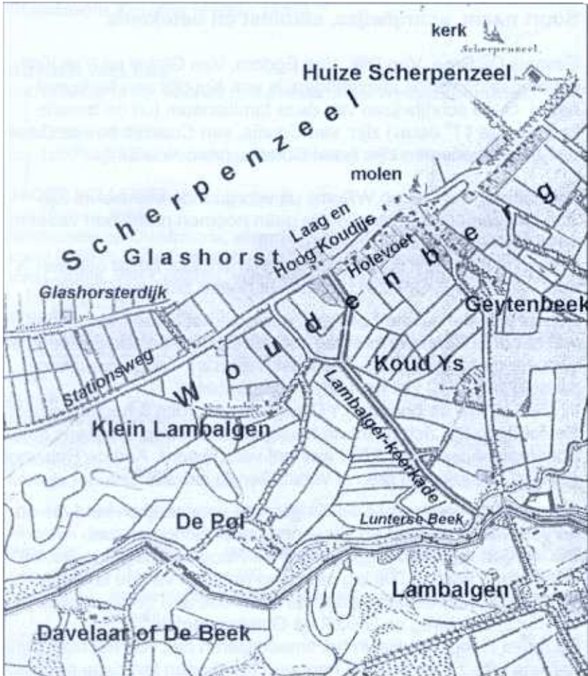
Boerderij "Koud Ys" onder Woudenberg en de landerijen "Laag-en Hoog Koudijs" (onderdeel van het erf Glashorst) onder Scherpenzeel, rond 1800. 21