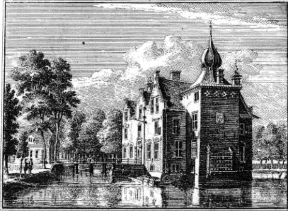
De RIDDER-HOFSTAD GROENEWOUDE, anders WOUDEBERG genoemd.