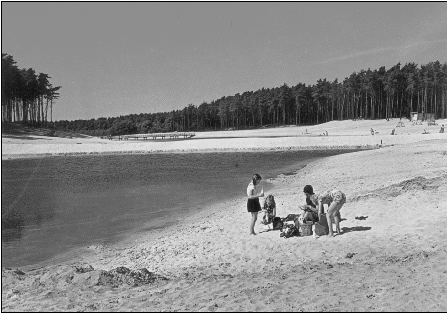
Badgasten aan het Henschotermeer begin jaren 70 van de vorige eeuw.

Het badseizoen begint 1 april en eindigt op 1 oktober. Het aantal bezoekers schommelt, afhankelijk van het weer, tussen de 200.000 en 300.000 per jaar. In het slechte zomerseizoen van 2007 kwamen er 'slechts' 100.000 bezoekers. Tijdens het seizoen is er toezicht op de naleving van de reglementen en sinds 2007 zijn er maximaal drie life-guards aanwezig, afhankelijk van de drukte.