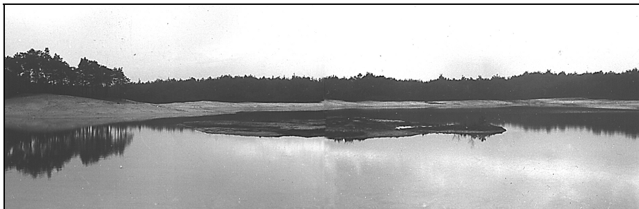
Het Henschotermeer op 23 juni 1948.

Oud-burgemeester van Woudenberg J.B. de Beaufort (1847-1924) had elf kinderen. Als herdenking aan de bevrijding in 1945 en om symbolisch een steentje bij te dragen aan de wederopbouw van ons land plantten zij in 1948 aan het Henschotermeer elf eiken, voor elke provincie één. Deze eiken werden omringd door hakhout om ze enigszins te beschermen tegen het stuifzand. Zij staan er nog steeds, aan de noordkant van het Henschotermeer. (Zie foto op blz. 3).