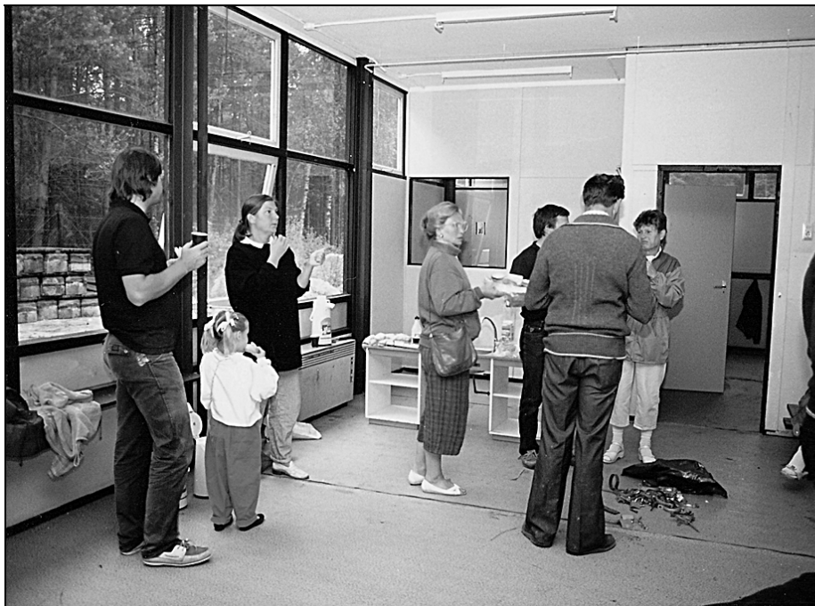
Vrijwilligers nemen koffiepauze in het noodlokaal dat opnieuw wordt opgebouwd en ingericht bij het Henschotermeer.

Op een grote dieplader werd het noodlokaal naar parkeerplaats 4 vervoerd, waar men de ruimte had om de school aan te passen aan zijn nieuwe functie.