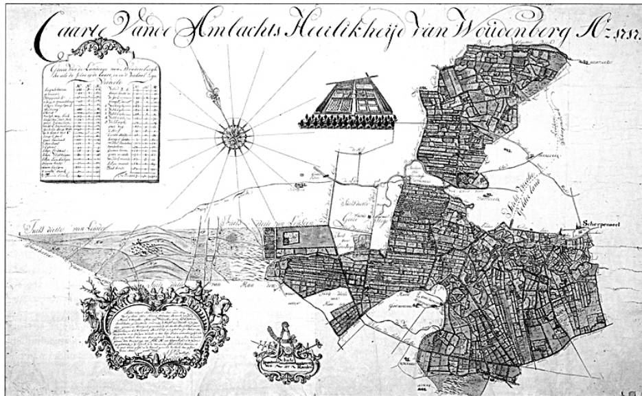
Kaart van Woudenberg (zonder Geerestein) uit 1717.

Op de plekken waar de dekzandruggen lagen zijn de eerste wegen dwars door het moeras en de bebouwing in de 13 e en 14 e eeuw ontstaan.