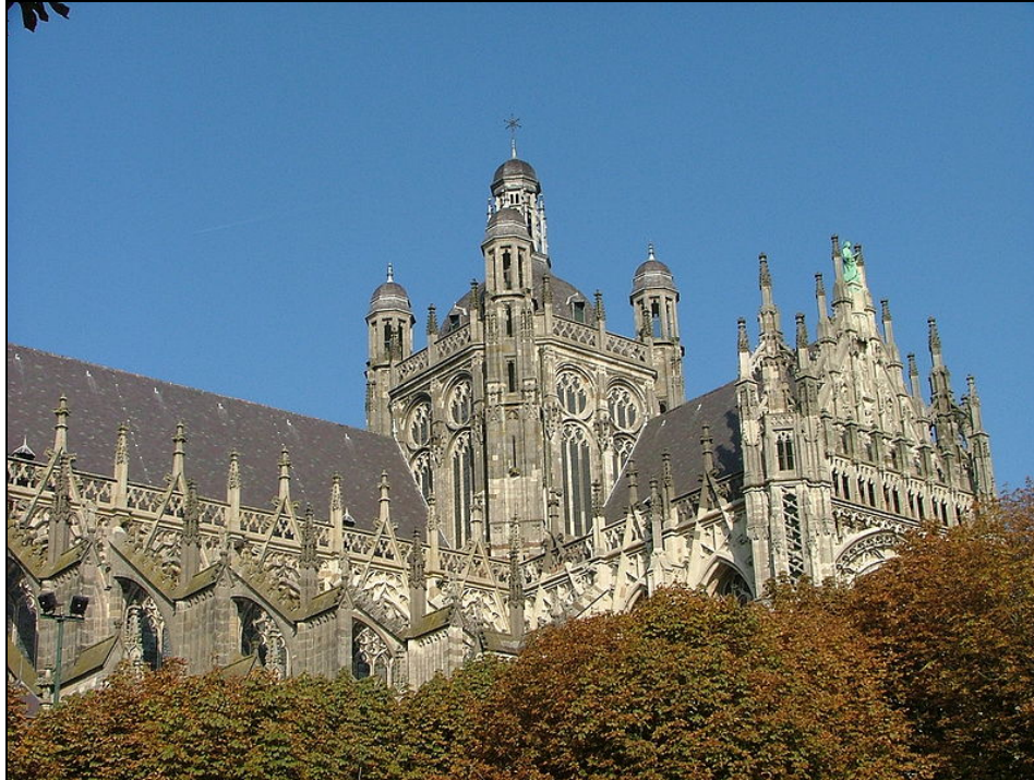
Een deel van het exterieur van de imposante kathedraal St. Jan in 's-Hertogenbosch.

Om kwart over negen werd de aftocht geblazen en kon worden terugzien op een zeer geslaagde dag.