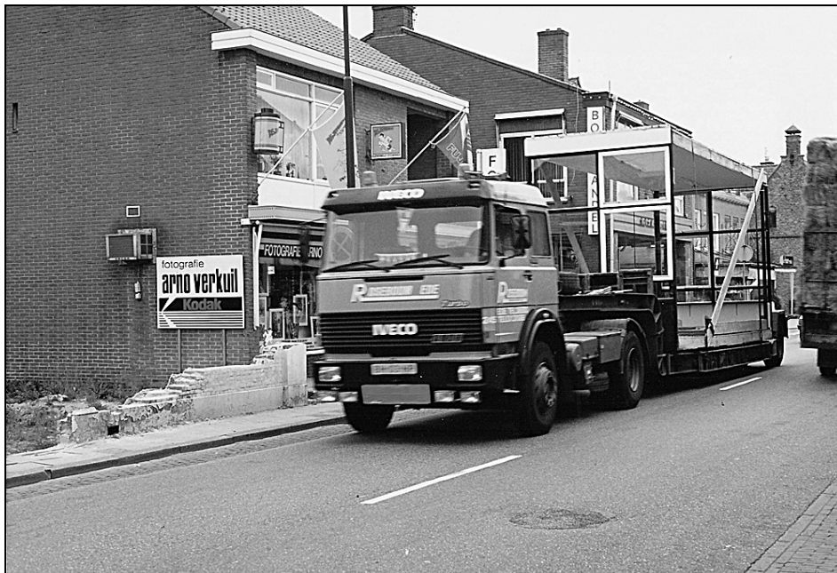
Een dieplader van Roseboom uit Ede is in de Voorstraat te Woudenberg op weg met het noodlokaal naar de nieuwe locatie bij het Henschotermeer.