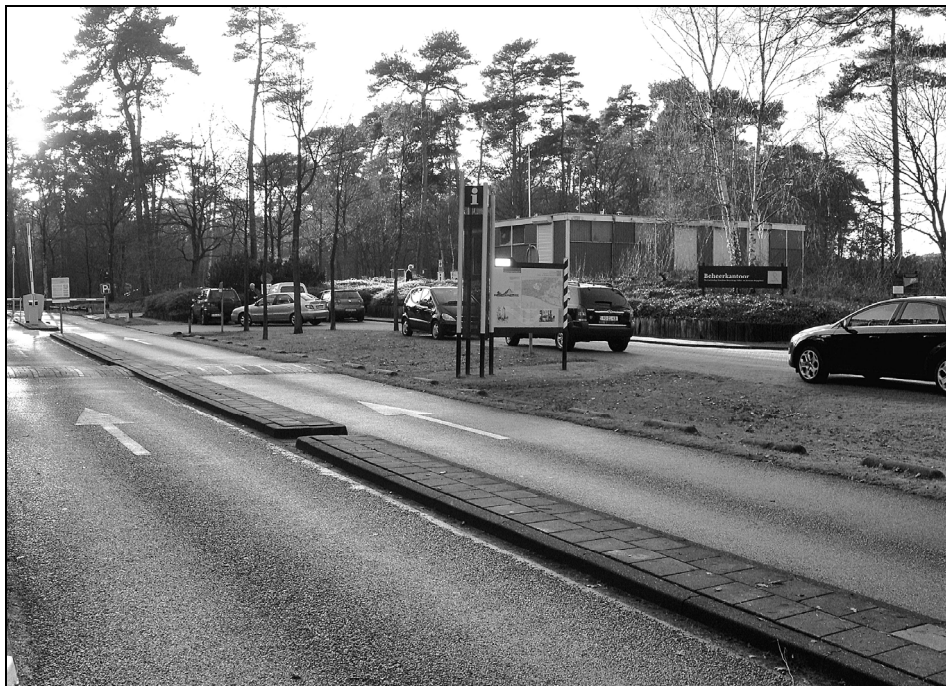
Het houten clubgebouw van de Langlaufvereniging bij de ingang van het Henschotermeer. Aan de andere kant bevinden zich kantoorruimten van het Recreatieschap.

Het gebouw doet sindsdien dienst als ontmoetingsruimte voor leden van de langlaufclub en is de uitvalsbasis voor vele activiteiten zoals skiles geven aan pupillen van de Heijgraeff of aan schoolkinderen enz. Naast deze ontmoetingsruimte zijn er ook enkele kantoorruimtes aangebouwd voor de beheerder van het Henschotermeer. Onder het gebouw bevindt zich een ruime kelder voor opslag van materiaal voor zowel de beheerder als de langlaufclub. Het onderhoud is zo geregeld dat het Recreatieschap het materiaal betaalt en de leden van de Langlaufvereniging de mankracht leveren. Er zijn vage plannen om, als het contract in 2011 afloopt, op deze plaats in de toekomst een restaurant te bouwen.