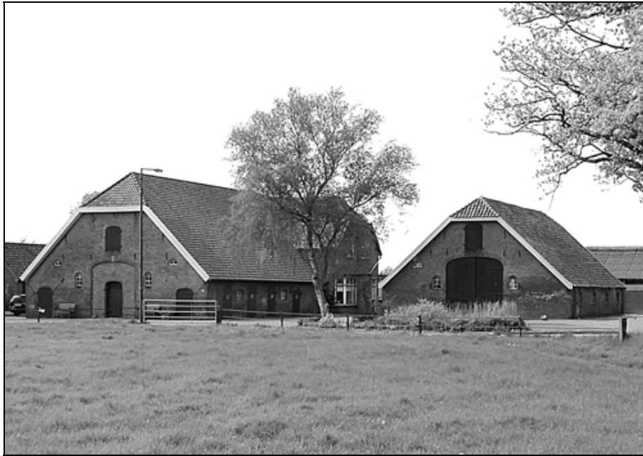
Klein-Haksfoort, Rottegatsteeg 3, Maarsbergen (foto W. de Greef, mei 2010)

Hier volgt het relaas van de heer Van Wolfswinkel.