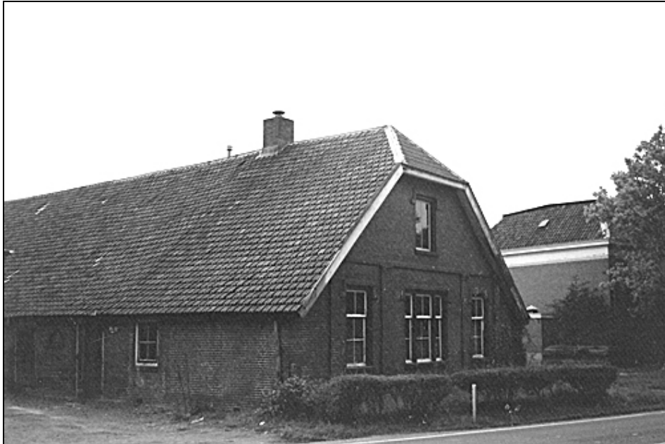
Boerderij De Boom, Geeresteinselaan 77, niet lang voor de afbraak in 1994. Rechts het nog bestaande voormalige koetshuis.

Hier volgt het relaas van de heer Jansen.