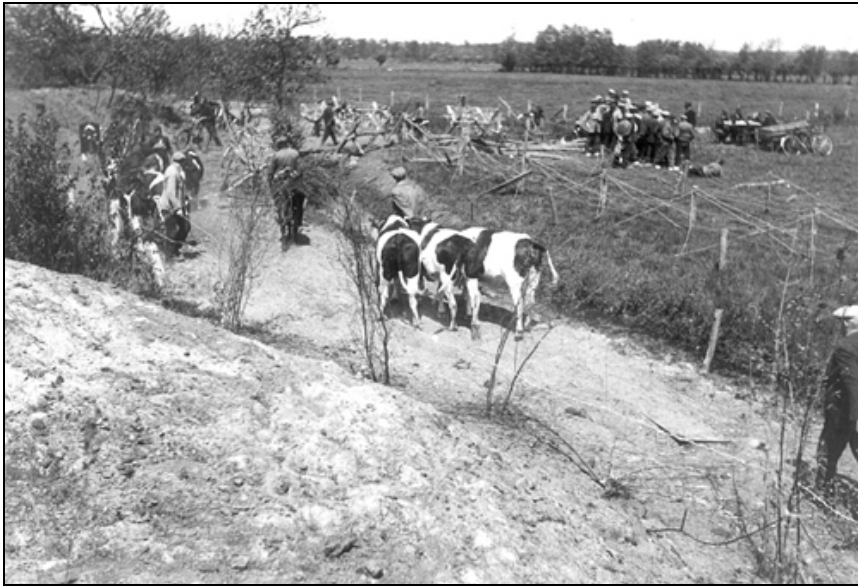
Terugkomst en verdeling van de koeien. 5