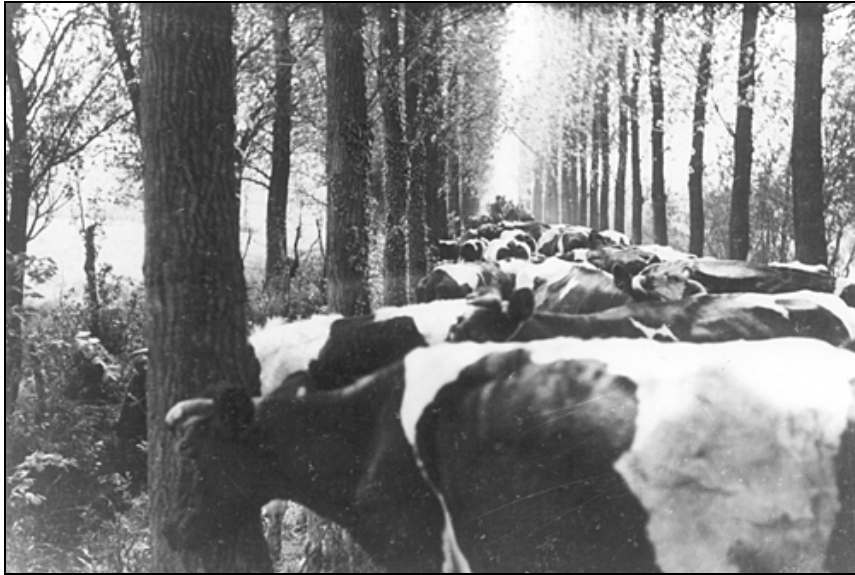
De koeien staan te wachten.