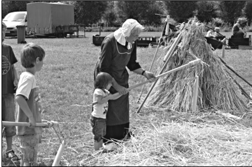
Vlegelen op de boerenmarkt van vorig jaar: de jeugd in actie.

Op 10 augustus vindt daar ook het kampioenschap vlegelen plaats. Zie ook www.vlegelmutsen.nl . Vlegelen is het handmatig dorsen van graan.