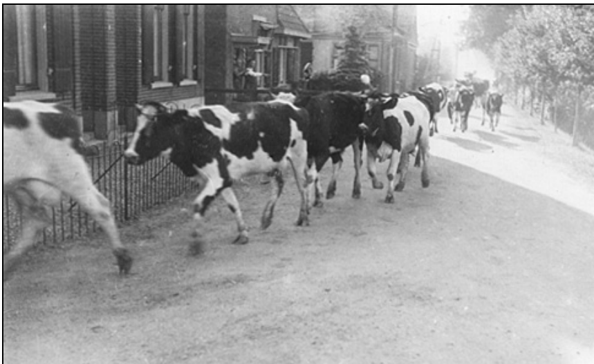
De koeien onderweg.