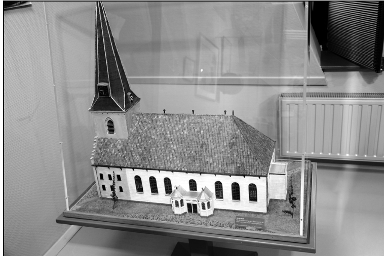
Maquette van de kerk aan de Schoutstraat voor de verbouwing in 1952, gezien vanaf de zuidkant. (maker de heer A.G. van Leeuwen)

Links van het café duiken we met kastelen en landgoederen de late middeleeuwen en de Gouden Eeuw in. De maquettes van de ridderhofsteden Geerestein en Groenewoude roepen nostalgische gevoelens wakker uit de tijd dat u nog boeken over ridders en jonkvrouwen las. In de vitrine ziet u een paar pronkstukken uit de collectie van Oud Woudenberg. Het oudste is het Jacobakannetje. Het mooiste de roemer (wijn glas) met inscriptie uit de 18e eeuw.