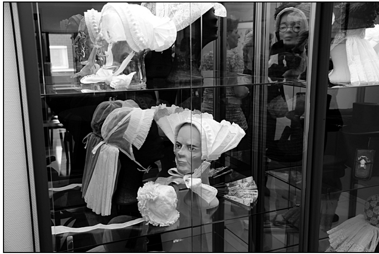
Een deel van de verzameling mutsen, onderdeel van de streekdracht.