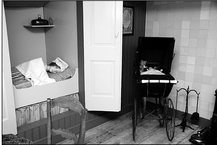
Nagebouwde woonkamer/heerd met bedstee uit 1900 door de familie Robbertsen.

aandenken aan de Bataafs-Franse tijd, opgeworpen door de soldaten van generaal De Marmont. De maquette geeft de situatie 1804 weer. De trommel, behalve het vel en de stokken, is een origineel uit die tijd. Om dat zeker te weten inspecteert u het certificaat naast de veldfles nog even.