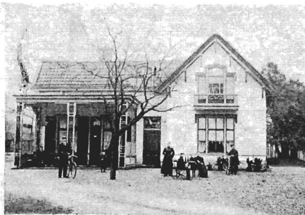
Hôtel „de Pyramide van Austerlitz”, gem. Woudenberg.