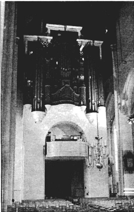
Walckerorgel in de Martinikerk te Doesburg